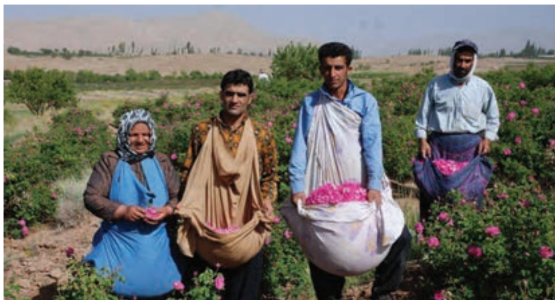
برداشت گل برای گلاب‌گیری