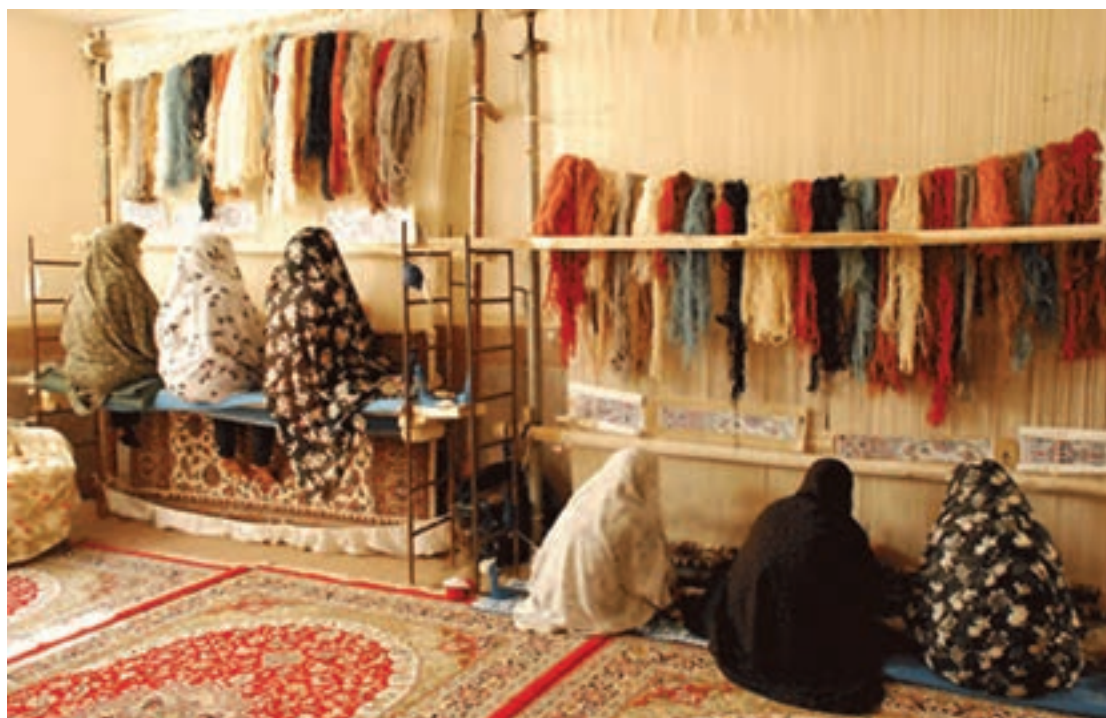
کارگاه فرش بافی (اشتغال و تولید)