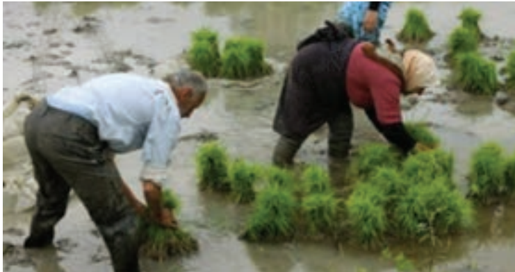
کار در شالیزار

به نظر شما آیا می‌توان ساعت کاری کارگران برای یک‌ماه را به روش دیگری نیز محاسبه نمود؟ با دوستان خود در این مورد بحث کنید.